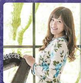
❄ さかもと 鈴