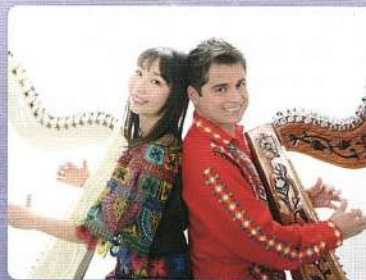
❄ アルパデュオ・ソソリーサ